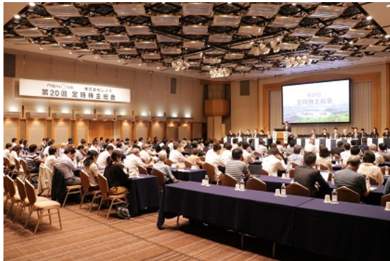
<第20回定時株主総会の様子>

その後、議長から決議事項の議案を説明・上程。株主の皆さまより、固定価格買取（FIT）制度終了後の当社事業に関するご質問や、当社が推進中の大型バイオマス発電事業、ならびに由利本荘市沖洋上風力発電事業の進捗状況、海外事業の今後の展望などに対する高いご期待とご声援のお言葉などを頂戴しました。（ご質問いただいた株主様数：11名）